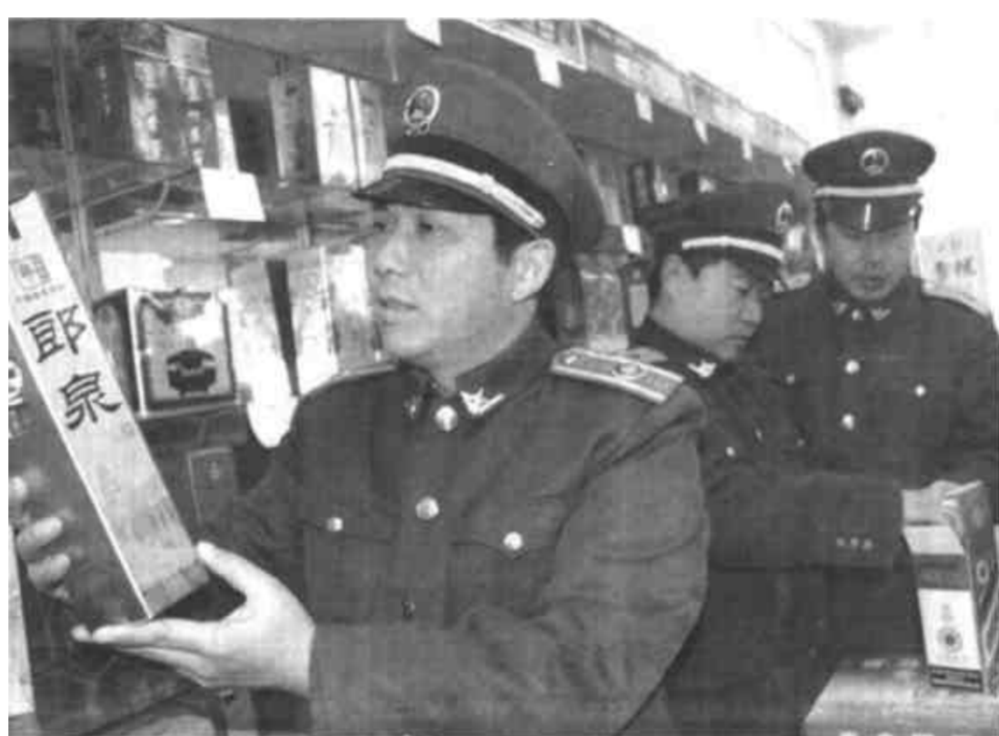
春节来临之际，利津县城关工商所对辖区的食品、酒类、药品等事关人民群众生命安全的商品进行全面检查，确保人民群众买上放心食品，过一个安全祥和的春节。

一是搞好镇区规划，着手实施镇政府东迁工程。在红旗路两侧开发建设商品房及住宅区，使城镇面貌逐步实现“住宅小区化”，以此带动镇功能区和工业园区的发展和完善。二是推进工业园区建设工程。建立以政府投入为引导，企业投入为主体，全社会投入为目标的多元化投入格局，加快西水工业园区、大海工业园区、城镇工业园区第二轮的规划建设，完善园区功能。同时制定优惠政策，鼓励企业到园区内落户经营，使城镇面貌达到“工业园区化”。三是实施交通网络优化工程。在孟胜路和刁孟路之间新建直通大海集团北厂的柏油路，对刁孟路进行拓宽改造，建成“四纵三横”的发达交通网。四是实施镇区美化工程。实行见缝插绿、连片播绿，搞好绿化，确保道路路况“六无六净”，镇容镇貌干净、整洁、风景化。（徐大为）