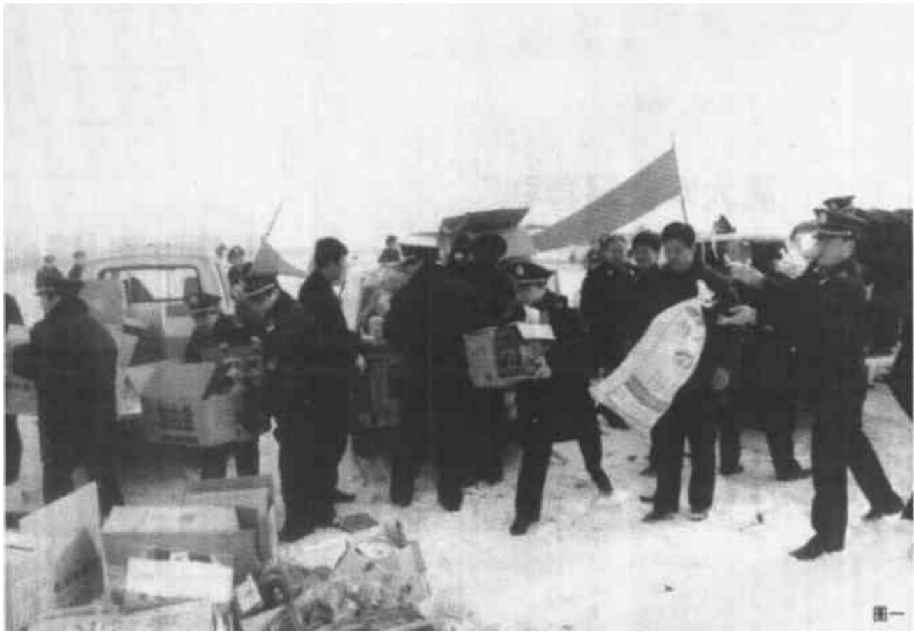
图一：工作人员正将假冒伪劣食品集中到一起。