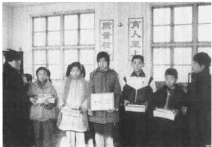
图一：春节前夕，河口区建设局慰问组来到结对帮扶的大平中学，给特困生送去慰问金和慰问品。

快板，歌曲都改编了词儿，小品相声更是别具特色。这个“小剧团”连“团长”带“演员”加起来总共11个人。一开始，“小剧团”只是在本村中演出，谁想，竟在附近“一炮打响”，群众被这种新颖别致的文艺节目所吸引，周围其它村庄听说后便也邀请他们进村演出。宣传内容有党的富民政策、计划生育政策以及经济建设、科技知识等方面的内容。不久，郭东村也仿而效之，成立了另一只“歌舞团”，与新华村形成“擂台”之势。他们走村串户，传播科技知识，活跃群众生活，很受群众欢迎。（张吉山）